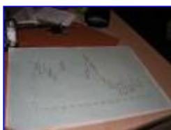
Výškový profil trati - druhé etapy

Zejména vzhledem k nepříznivému počasí v neděli 2.10.2005 velmi špatně. U všech soutěžících, kteří se účastnili loni i letos, byl zřejmý propad, který nebyl dán náročností trati. Vliv na něj nepochybně mělo doporučení nevypínat motor a špatné (deštivé a větrné) počasí po druhý den soutěže. Má posádka si v rámci snahy o dokonalé projetí připravila i výškový profil trati, avšak jeho praktické využití (přizpůsobování stylu jízdy) se blížilo nule. Pohled do solidní mapy byl účinnější, než použití výstupů této složité a časově náročné metody.