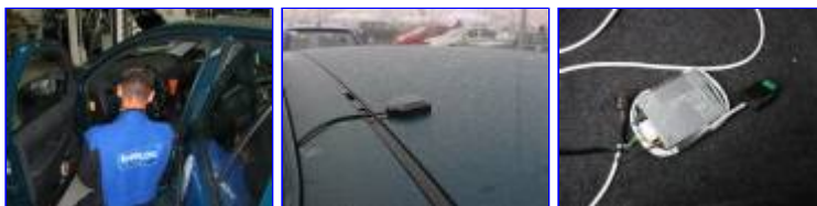
Montáž satelitního zařízení --- Satelitní přijímač a vysílač "pohozený" na podlaze --- Detail antény satelitního zařízení

Vypínání motoru za jízdy při vhodné příležitosti patří k základním a oblíbeným metodám snížení spotřeby paliva. Z důvodů horší či spíše žádné funkčnosti posilovačů řízení či brzd je všeobecně považován za prvek snižující bezpečnost silničního provozu. Výzva organizátorů k nepsané a neformální dohodě o nepoužívání tohoto prvku se při rozpravě před první etapou setkala s celkem silnými emocemi s tím, že vypínání motoru za jízdy není regulováno ani zákonem, ani propozicemi soutěže. Vedení podniku apelovalo na aspekty bezpečnosti a v rámci prvního nasazení satelitního systému (napojeného na řídicí jednotku vozu) žádalo o respektování tohoto požadavku.