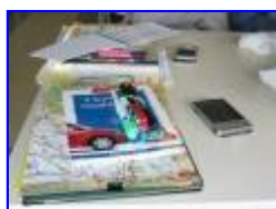
Příprava před vyjetím do etapy

Pro výpočet časových bodů (kde v kolik hodin být tak, aby byl plněn časový limit) jsem letos použil kapesní počítač, což výrazně zjednodušilo a urychlilo proces výpočtu průběhu jízdy. O spolehlivosti nemluvě. Díky použití kapesního počítače jsme také při tankování v cíli s přibývajícím litry věděli, jak na tom jsme se spotřebou a dokázali se takzka "on-line" srovnat s ostatními, ještě při vlastním čerpání paliva.